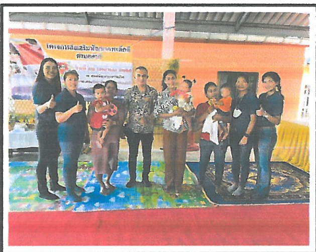
กิจกรรมหนูน้อยเติบโตตามวัย