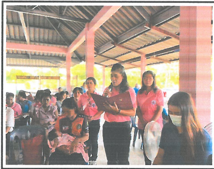
ประธานชมรม อสม.รพ.สต.บกปุยกกล่าวรายงาน