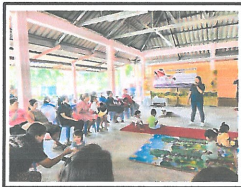
แลกเปลี่ยนเรียนรู้การดูแลสุขภาพระหว่างตั้งครรภ์และทารกในครรภ์มารดา , การเลี้ยงลูกด้วยนมแม่สำเร็จ และทำการให้นมลูก การบีบเก็บน้ำนม