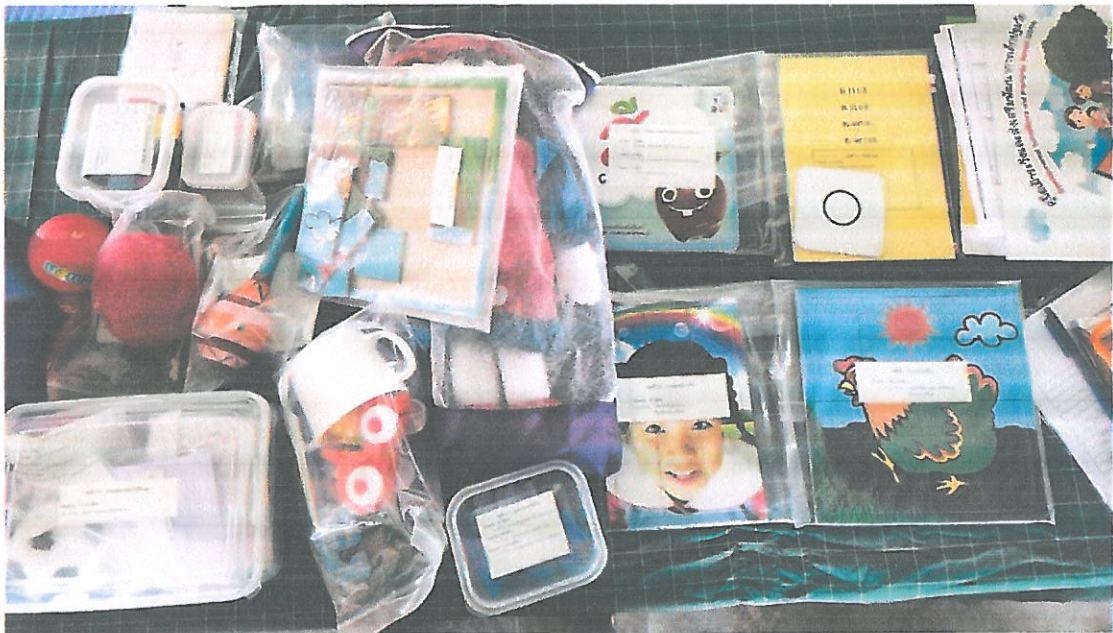
ชุดสาริตพัฒนาการเด็กตามกลุ่มอายุ