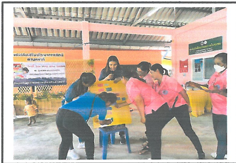
กิจกรรมวัคซีนลูกรัก