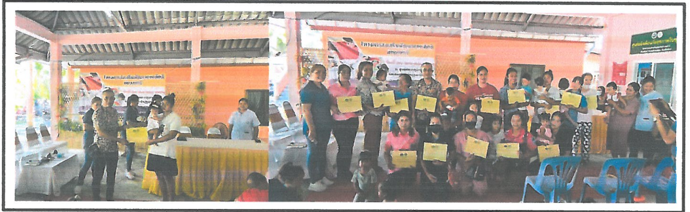
รองนายกอบต.ลำภีมอบเกียรติบัตรให้แม่ที่เลี้ยงลูกด้วยนมแม่ครบ 6 เดือน